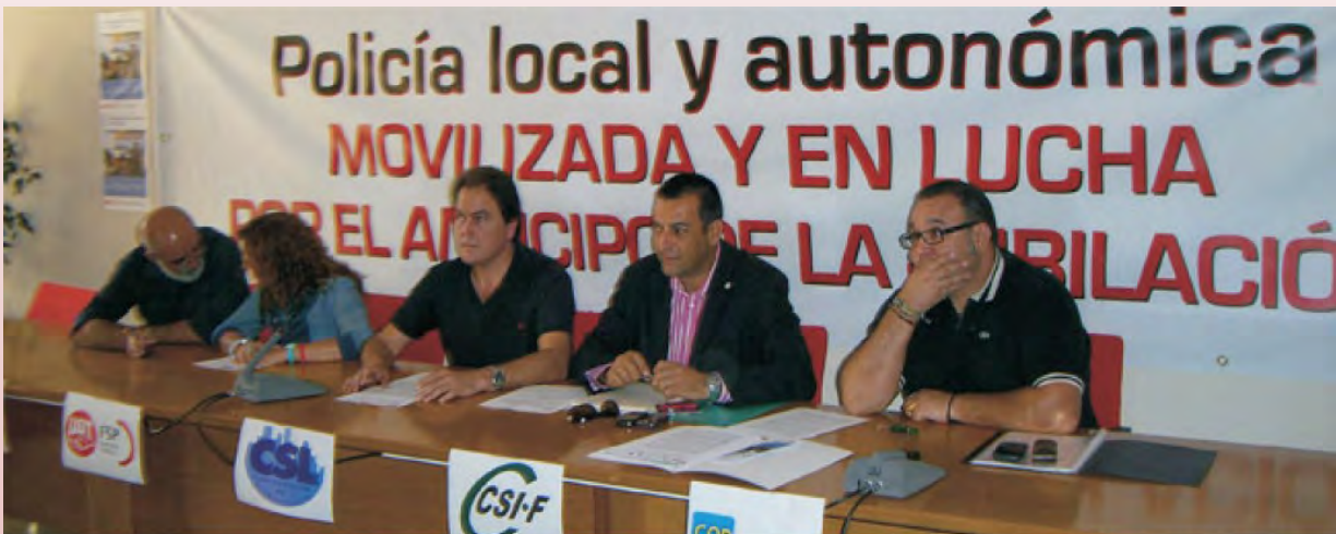
Los sindicatos unifican plenamente su exigencia ante el gobierno de adelantar la jubilación de los Policias, tanto autonómicos como Locales

Estamos ante una medida que no supondrá coste alguno para las arcas públicas, pues serían los propios afectados quienes, con el aumento de la cotización a la Seguridad Social, sufragarían esta medida que, por otra parte, cumpliría con lo dispuesto en el Estatuto Básico del Empleado Público.